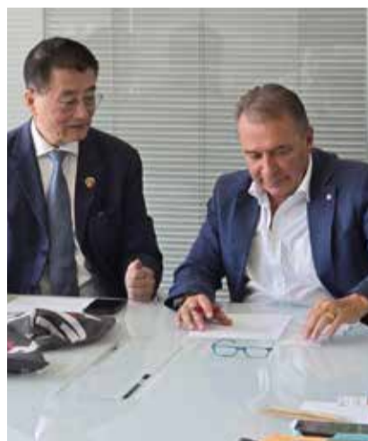
L'incontro dell'assessore regionale Paolo Bongioanni (in alto, a destra) con la delegazione della Camera di Commercio cinese

https://www.regione.piemonte.it/web/pinforma/notizie/eccellenze-piemontesi-sul-mercato-cinese