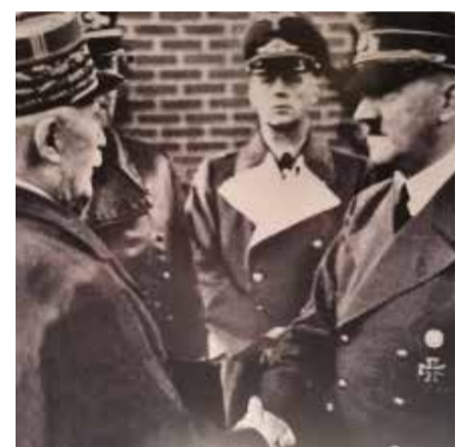
In alto, il maresciallo di Francia Philippe Petain con Adolf Hitler. Il suo Governo collaborazionista ebbe sede a Vichy. Sotto, pannelli della mostra permanente di Norimberga