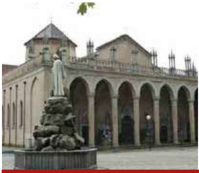
Duomo Il tempio dedicato a S. Maria Maggiore e S. Stefano