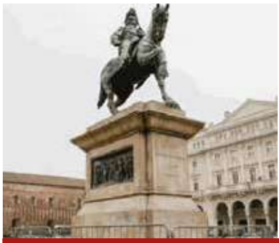
Statua equestre di Vittorio Emanuele II in piazza Mariri