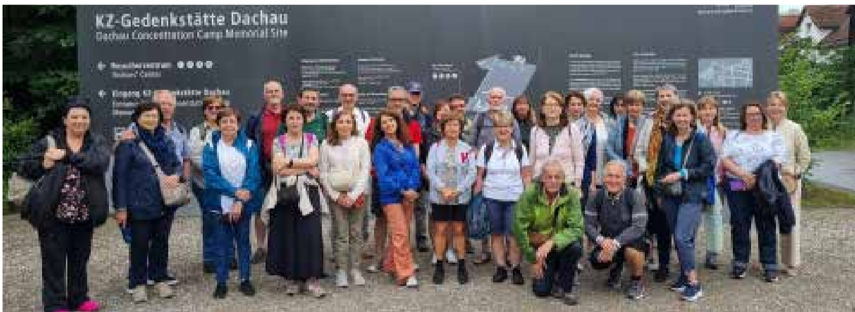
Il gruppo di docenti ed appassionati di storia all'ingresso del campo di concentramento di Dachau, con i formatori dell'Israt. Sotto, un forno crematorio

Visita ai campi di Dachau e Natzweiler-Struthof, per studiare i sistemi nazisti di repressione del dissenso