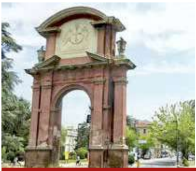
Simbolo della città raggiungibile da Piazza della Libertà: l'Arco di Trionfo