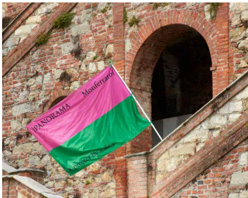
Tutto pronto per "Panorama Monferrato", mostra diffusa di arte antica, moderna e contemporanea organizzata ogni anno dalla rete istituzionale Italics

Architettura ed arte a Camagna, Vignale, Montemagno e Castagnole