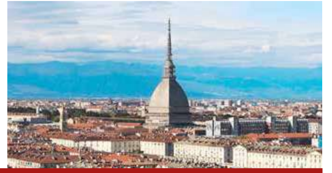
La Mole Antonelliana