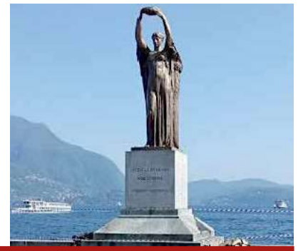
Monumento ai caduti sul lungolago