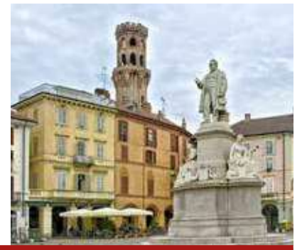
Piazza Cavour la piazza centrale di Vercelli