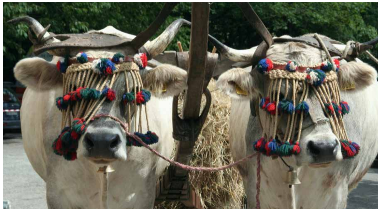
Buoi grigi alpini, e, a destra, una immagine d'epoca di una vecchia edizione della Fiera

Domenica 28 luglio tradizionale Fiera di Sant'Isidoro nell'Appennino piemontese