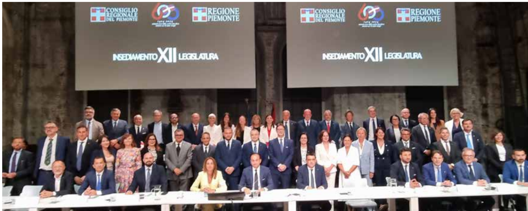
Foto di gruppo della Giunta regionale e dei consiglieri della XII legislatura, insediatisi nella giornata di lunedì 22 luglio alle Ogr di Torino, che hanno potuto ospitare il folto numero di partecipanti tra il pubblico. Palazzo Lascaris è infatti ancora in ristrutturazione e la sala consiliare, che durante il cantiere è stata trasferita in Sala Viglione, non sarebbe stata sufficientemente capiente

In primo piano le sfide delle assunzioni in sanità e dell'introduzione di un nuovo sistema di prenotazioni