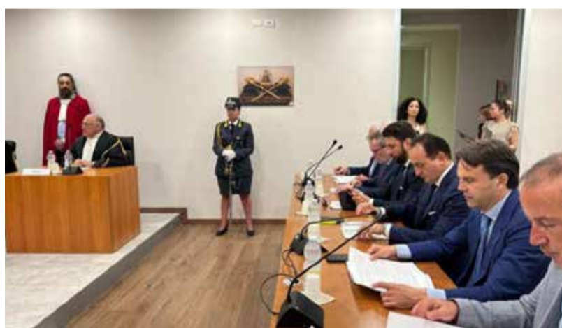
L'udienza della Sezione regionale di controllo della Corte dei Conti

I numeri. Nel 2023 il debito rispetto all'anno precedente è stato