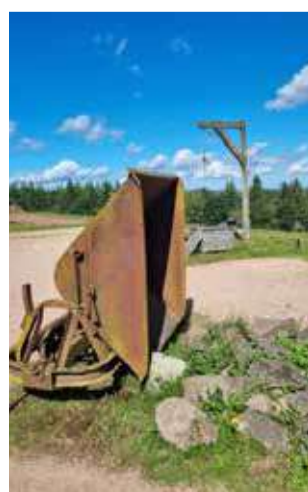
L'ingresso del campo di concentramento nazista di Natzweiler, tra i monti Vosgi. A destra, il patibolo del campo