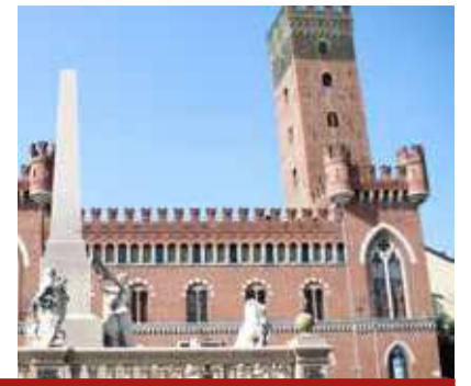
La Torre Comentina nel centro storico di Asti