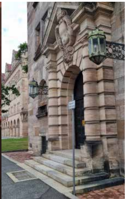
La sede del Processo di Norimberga, dove (al centro) dal 20 novembre 1945 il Tribunale militare internazionale giudicò i capi nazisti rimanenti o ancora ritenuti in vita