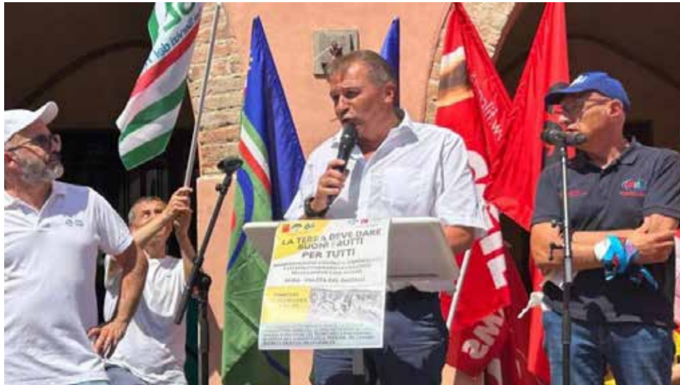
L'intervento dell'assessore regionale all'Agricoltura, Paolo Bongioanni, alla manifestazione di Alba

È l'assunzione di 514 nuovi ispettori Inps e Inail, che sarà sicuramente determinante e alla quale attingeremo anche in Piemonte. Mi sono speso per tenere questo incontro allargato già la scorsa settimana, insieme al presidente Cirio e al vicepresidente e assessore competente Elena Chiorino». Fin dal 2020 la Regione Piemonte ha varato il cosiddetto Protocollo Saluzzo, un progetto pilota che ha messo insieme e coordina Prefettura di Cuneo, Comune di Saluzzo e altri Comuni del distretto frutticolo nel fornire servizi di sostegno ai lavoratori stagionali (lettura contratti, mediazione interculturale, orientamento ai servizi del territorio) e un sistema pubblico di abitazioni temporanee per far fronte al bisogno alloggiativo dei braccianti che non trovano sistemazione presso le imprese stesse. Nei 10 Comuni aderenti sono state create "case" con oltre 250