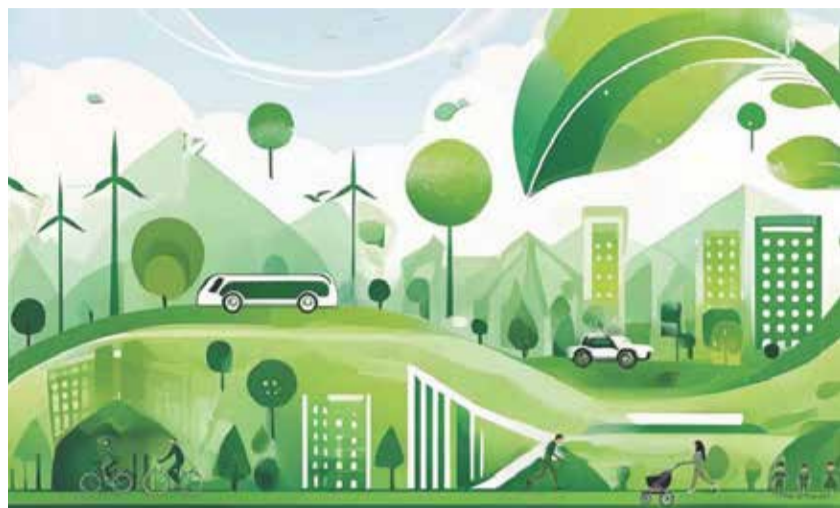
Il Piano della qualità dell'aria comporta interventi per circa 4 miliardi, in quattro settori

Al via l'iter per il suo aggiornamento. Ora la valutazione ambientale strategica