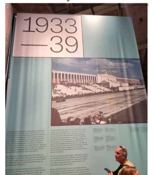
israt Istituto per la Storia della Resistenza e della Società Contemporanea in Provincia di Asti

mandia, con visite al paese martire di Oradur-sur-Glane (incendiato dopo l'eccidio nazista di 643 persone, ma mai ricostruito, con le rovine volutamente mantenute intatte dai francesi, a perenne memoria) ed alle spiagge dello sbarco. «Il tema del viaggio di quest'anno - afferma la direttrice Israt, Fasano - è stata "La guerra dei trent'anni del '900 europeo": abbiamo voluto evidenziare il tema delle terre contese di confine come l'Alsazia, gli spostamenti di popolazione, l'affermazione del nazismo e i meccanismi di creazione del consenso in un regime totalitario e, attraverso la visita dei lager di Natzweiler e di Dachau, il sistema repressivo del dissenso».